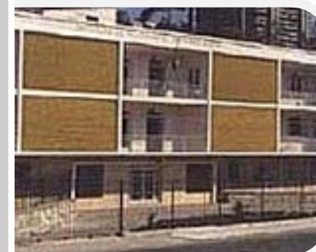
Instituto Deolindo Couto

Av. Pedro Calmon, nº 550 - Prédio da Reitoria Ilha da Cidade Universitária / Rio de Janeiro - RJ Cep: 21941-901 www.ouvidoria.ufrj.br Tel: (21) 2598-1620