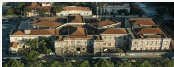
Hospital Escola São Francisco de Assis

Por esse motivo a Reitoria da Universidade Federal do Rio de Janeiro designou a Ouvidoria-Geral para coordenar um Grupo de Trabalho com representantes das diversas Unidades Hospitalares, que formam o Complexo Hospitalar da UFRJ, visando a elaboração de uma Carta de Serviços ao Cidadão , com o objetivo de oferecer aos seus usuários as informações essenciais sobre os serviços que prestam e a sua relação com a comunidade que necessita e utiliza esses serviços.